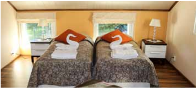
▲ Pyyhkeiden taiteelliset taittelut tuovat ripauksen Thaimaata myös Pajuniemen Kartanoon.