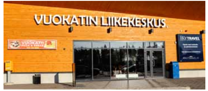
▲ PKY Travel näkyy myös Vuokatin Liikekeskuksessa, josta löytyy myös yrityksen myyntikonttori.